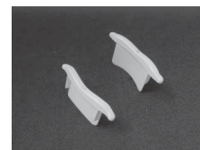
EMBOUT DE LAME

PROFILÉ H : 42mm Ép : 9,3mm Poid : 2,85kg/m 2 Ép matière : 0,30mm